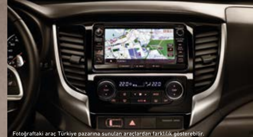
Fotoğraftaki araç Türkiye pazarına sunulan araçlardan farklılık gösterebilir.